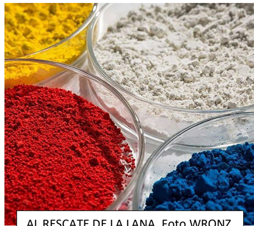
AL RESCATE DE LA LANA.

Un posible producto de lana es el champú y otros productos relacionados con el cabello que contienen queratina.